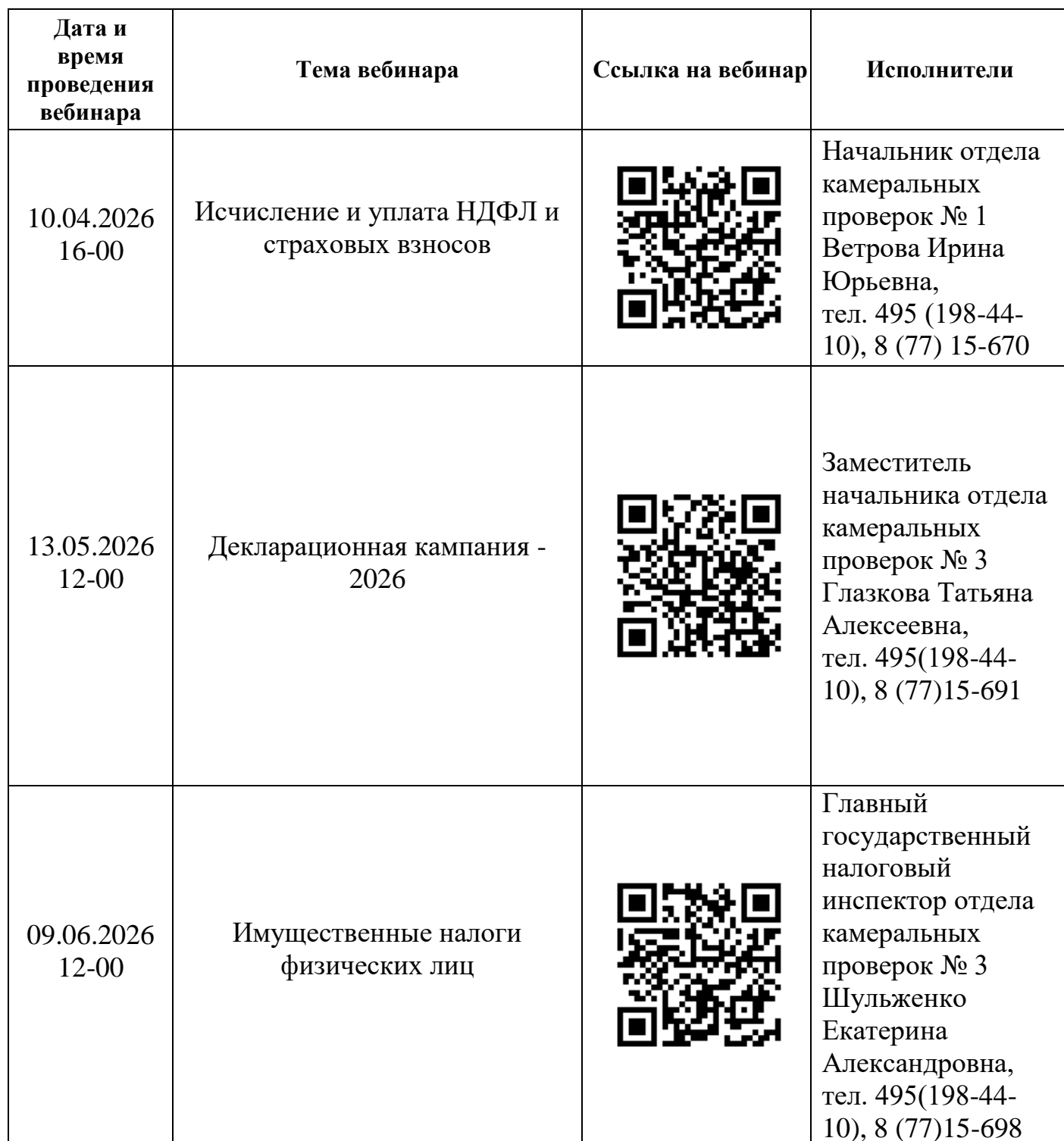
График проведения вебинаров с налогоплательщиками во 2 квартале 2026 года в ИФНС России № 17 по г. Москве